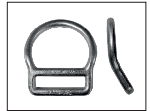
Halteöse (D-Ring, gebogen), geschmiedeter Stahl