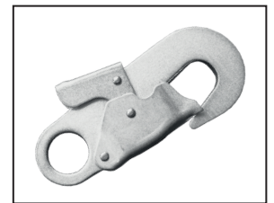
IKV 06 (EN 362:2004)