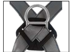
Auffangöse (D-Ring), geschmiedeter Stahl