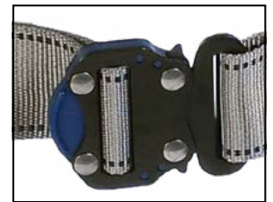
Schnellverschluss, beschichteter Stahl