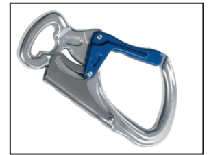
IKV 11 (EN 362:2004-T)