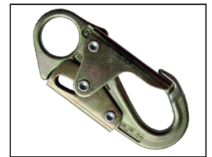
IKV 28 (ANSI Z.359.1-2007; CSA Z259.12-2011)